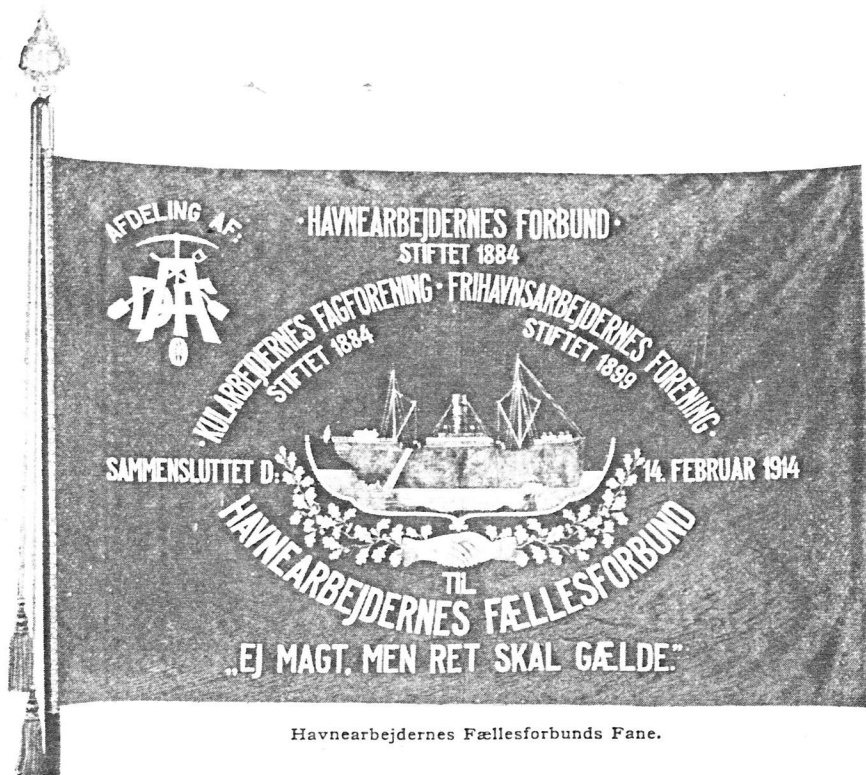
Havnearbejdernes Fællesforbunds Fane.

lemsmøder og Generalforsamlinger, hvor Syndikalisterne gjorde sig stærkt gældende og søgte at faa, og i mange Tilfælde ogsaa fik, den afgørende Indflydelse paa de Beslutninger, der skulde tages.